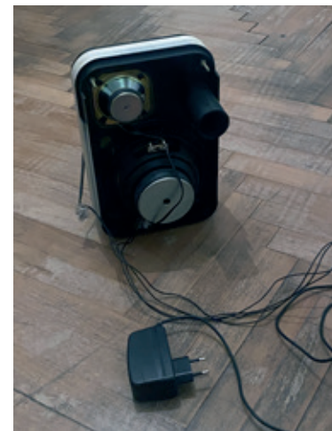
Giacomo Segantini Senza titolo (sassaia) , 2019 C-print su alluminio 23 x 11,85 cm